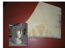
Teil A: Steinphänomene in interdisziplinärer Perspektive Teil B: Szenen zur Schulpraxis