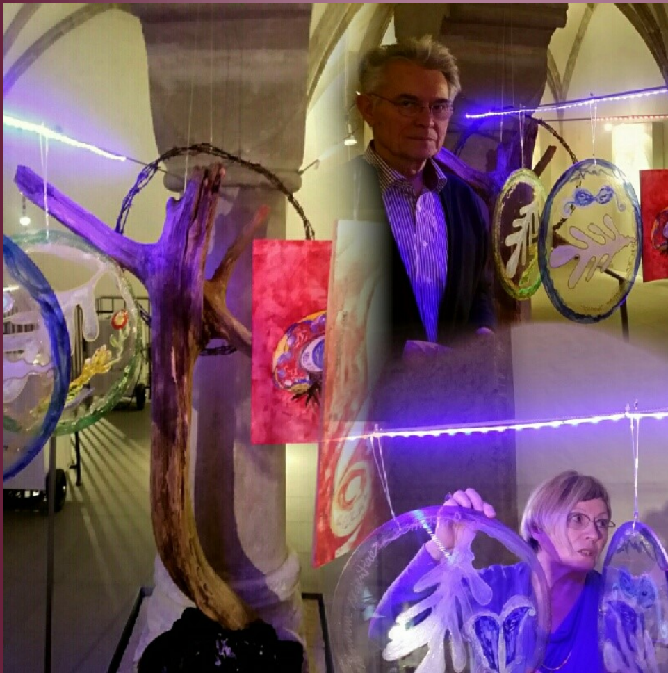
anmutungsgemäßen Schauen und interaktives Nachdenken